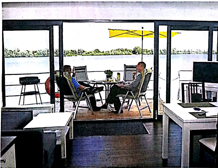
Peter Kummer erhält den Schlüssel für eine Nacht im Floating House (im Hintergrund). Das liegt in Vynen vor Anker und ist – siehe unten – modern sowie mit aller Haustechnik eingerichtet.